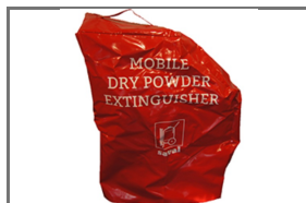
VERRIJD BARE BLUSTOESTELLEN BESCHERMHOEZEN