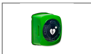
ROTAID SWIFT AED KAST