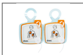
AED DEFIBRILLATIEPADS VOOR KINDEREN - POWERHEART G5