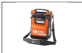
AED DRAAGTAS POWERHEART® G5