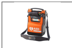
POWERHEART® G5 AED TRAINER