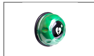
ROTAID SOLID PLUS AED KAST