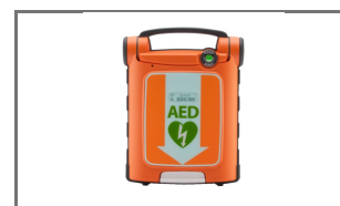
CARDIAC SCIENCE POWERHEART G5