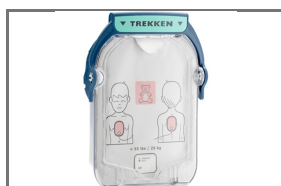
SMART HEARTSTART DEFIBRILLATIE CASSETTE BABY/KIND