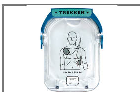
SMART HEARTSTART DEFIBRILLATIE CASSETTE VOLWASSENEN