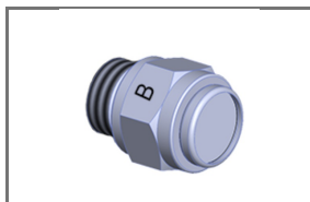
NOZZLE TYPE B