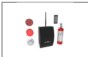
REFLEX™ ACC MODULE