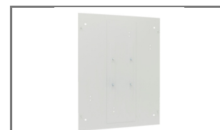
ACHTERWAND VOOR COMBINATIEKAST