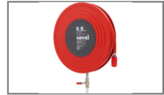
DECO-D RVS ROOD