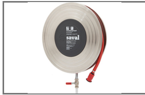
DECO-D RVS BLANCO