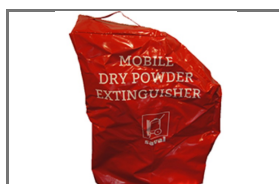
VERRIJDBARE BLUSTOESTELLEN BESCHERMHOEZEN