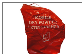
VERRIJDBARE BLUSTOESTELLEN BESCHERMHOEZEN