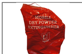
VERRIJDBARE BLUSTOESTELLEN BESCHERMHOEZEN