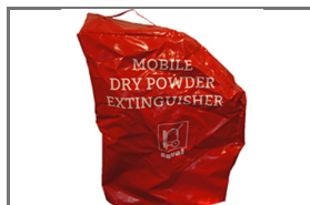
VERRIJDBARE BLUSTOESTELLEN BESCHERMHOEZEN