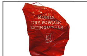
VERRIJDBARE BLUSTOESTELLEN BESCHERMHOEZEN