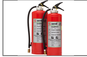
BP HR SCHUIMBLUSSER