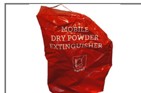
VERRIJDBARE BLUSTOESTELLEN BESCHERMHOEZEN